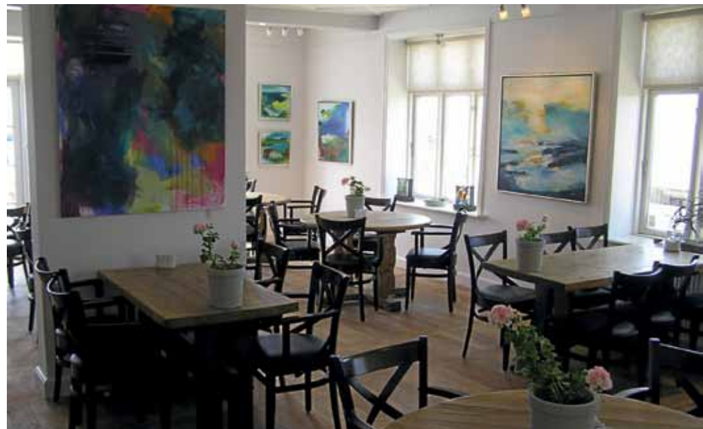
Hjørtning Badehotel har udnyttet, at hotellet ligger på den vestjyske kunstrute langs vandet. Der udstilles nu lokale kunstnere i caféen.

Badehotel, har Esbjerg Kommune fortsat udviklingen i området med en forandring af strandpromenaden i Hjørtning, så der i hele området i dag er en god sammenhæng mellem stranden, promenaden og badehotellet, som oprindeligt blev bygget 1914.